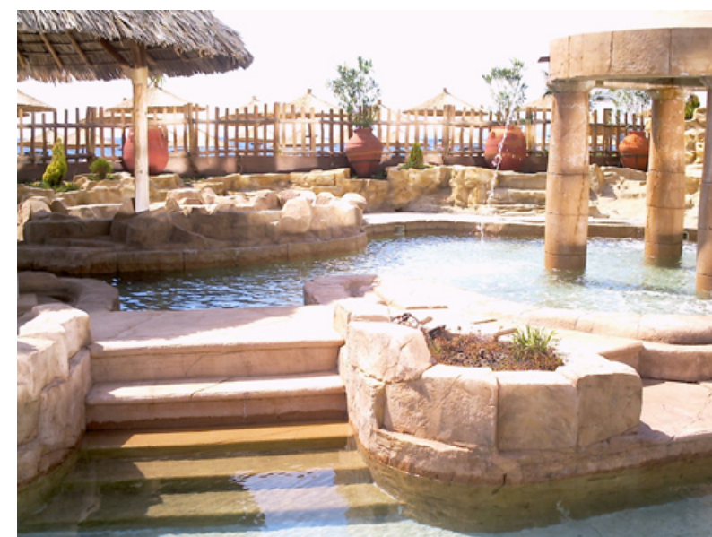
Kneippův okruh s mořskou vodou