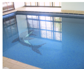
Relaxační bazén se salinitou Mrtvého moře

Co mi ČSR dala? To, co jsem, v nehlubší podstatě. Nevzala mi nic, systém mi vzal vlast, lásky a přátelství, ale jen geograficky. Tím, že mě vykopli, mi pomohl přesáhnout mé vlastní limity, získat sebevědomí, lásku a úctu k sobě samé, dotvořit sebe profesionálně, dát mi světový rozhled a pohled s odstupem na život, v holistickém slova smyslu.