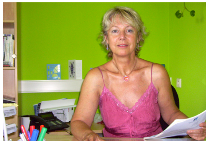
Hana v inspirující zelené kanceláři

Kvůli ochraně rodiny a své potřebě se vracet jsem neemigrovala, ale s pomocí ze zahraničí jsem odcházela kvůli politické persekuci legálně, po „green card“ svatbě s Francouzem, který byl momentálně k dispozici.