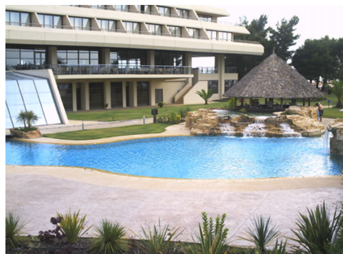
Vodní bar s lagunami