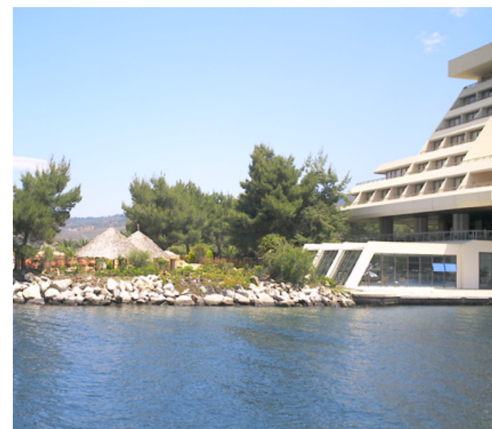
Vnitřní a vnější Vodní svět